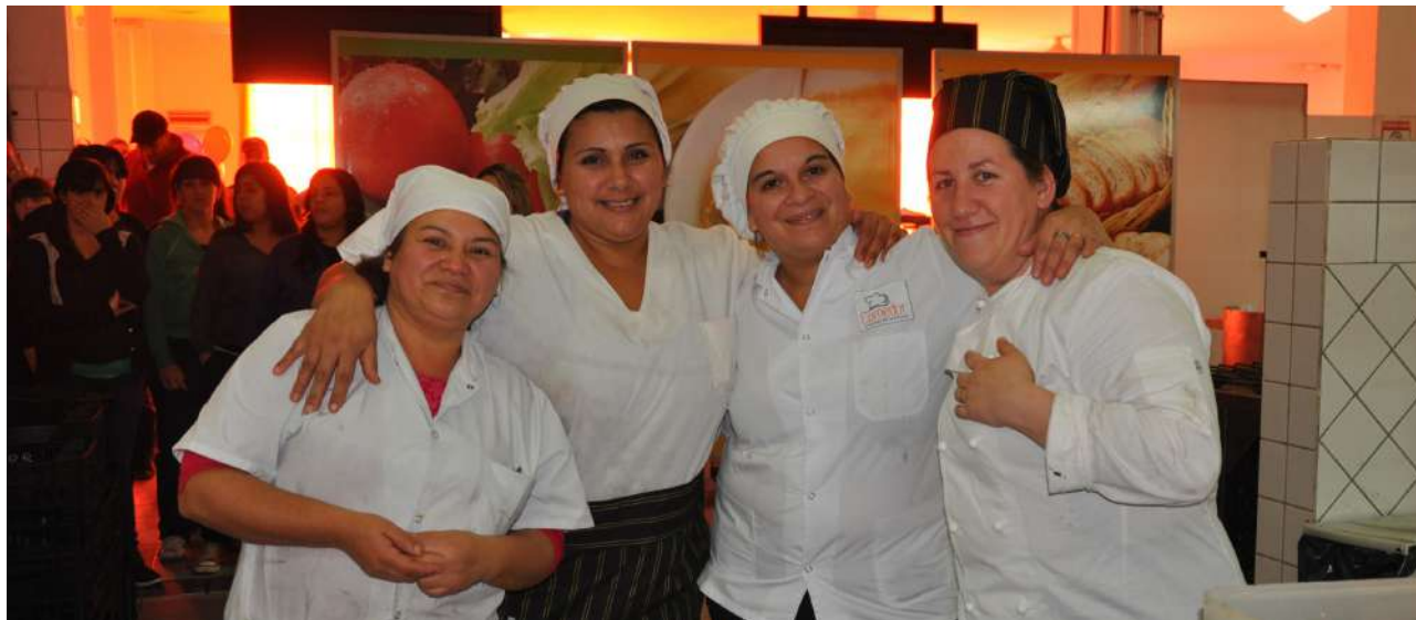
Compañeras del comedor del Astillero Río Santiago