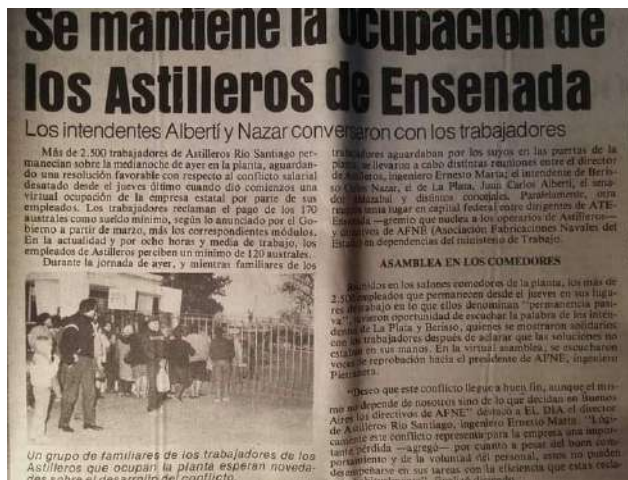
Recortes de notas periodísticas sobre la “Permanencia”