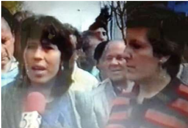
años 90.

“Yo vivía en las cuatro paredes de mi casa y cuidaba de mis hijos y esposo y nada más. Eran tiempos muy duros donde una se escondía de sus hijos y esposo, para llorar porque la situación era muy desesperante, pero nunca dejamos la lucha porque sabíamos que ese era el camino para ganar.”