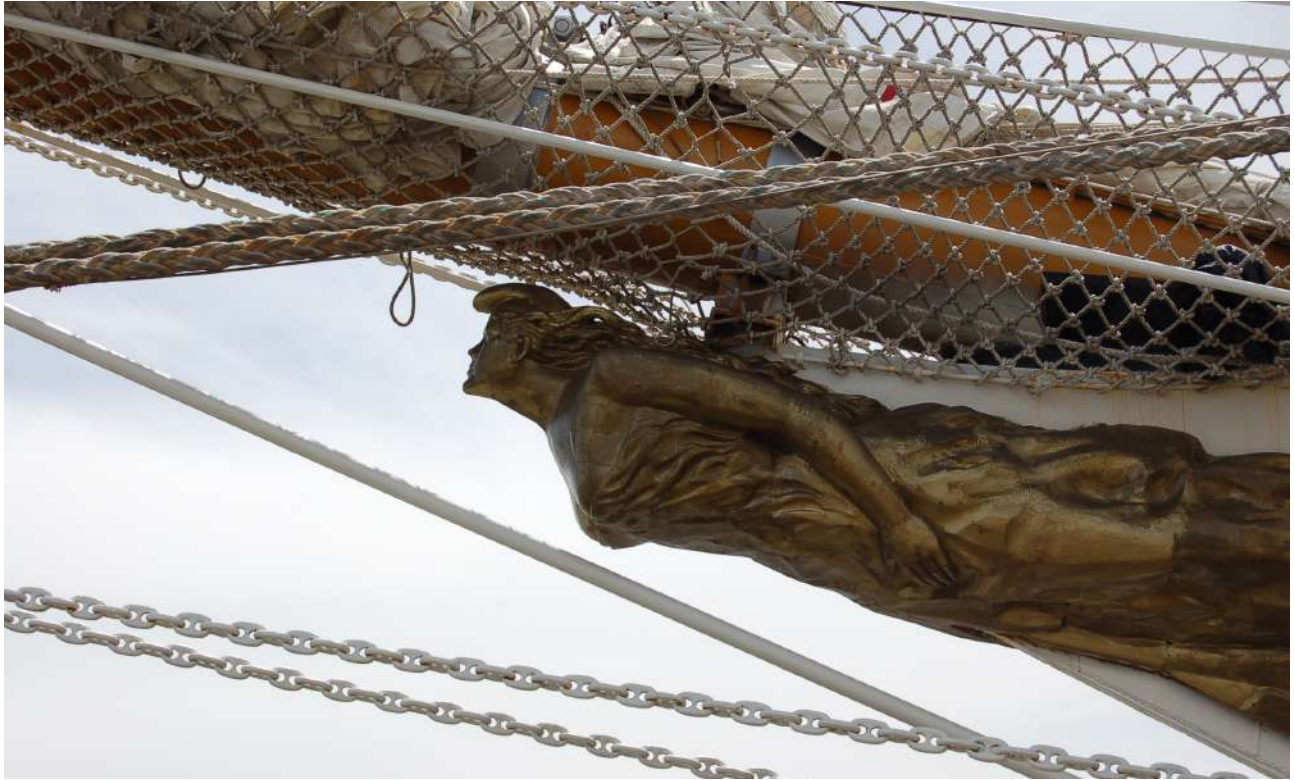
Mascarón de proa de la Fragata Libertad, construida en el Astillero Río Santiago