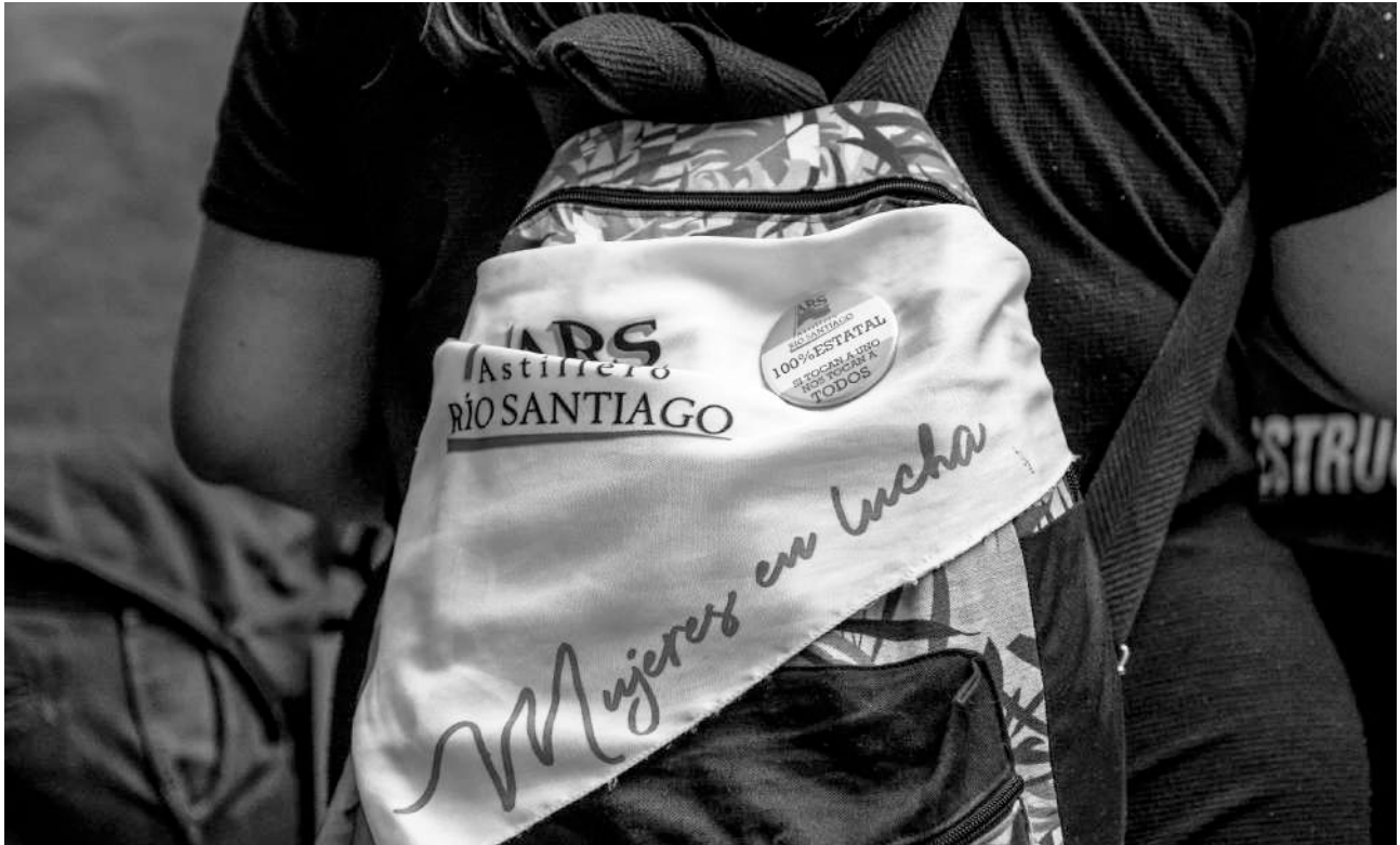
Mujeres en una movilización en La Plata en 2018.