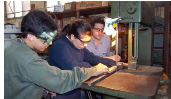
Alumnxs de la ETARS en el taller