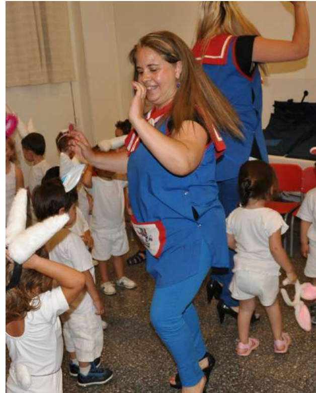
Jardín Maternal del Astillero Río Santiago

“Desde el Departamento de Arquitectura, y como equipo de mujeres, destacamos la importancia de poder aplicar nuestros conocimientos tanto desde lo profesional, como desde el enfoque personal, dando respuestas a