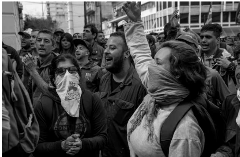
Mujeres en una movilización en La Plata en 2018.

“No me gusta la desidia en la que dejaron al ARS, desamparado, con mala fama para la gente catalogándonos de vagos. Muchos de nosotros hemos puesto de nuestro bolsillo para comprar cosas y poder trabajar, solo por amor a la fábrica.”