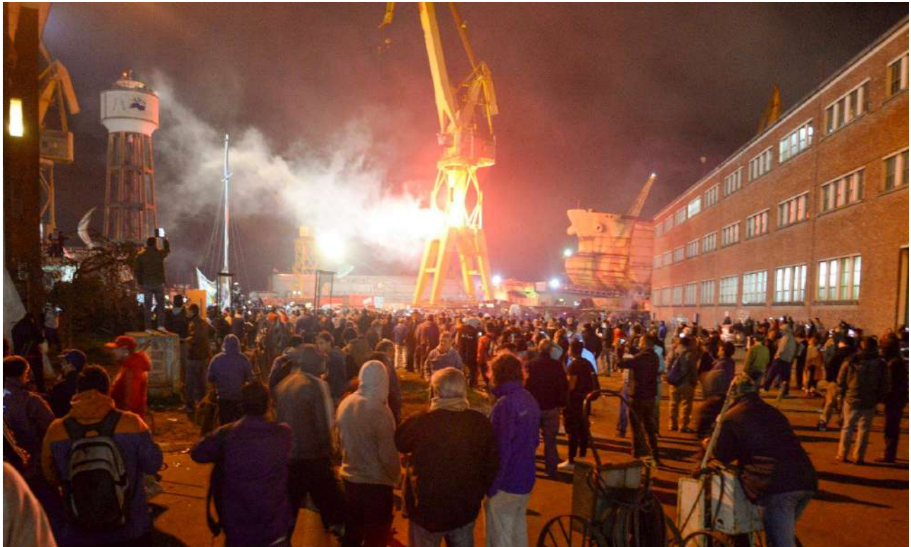
Protesta nocturna dentro de la fábrica en 2018.