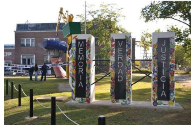
Monumento a lxs desaparecidxs dentro de ARS.