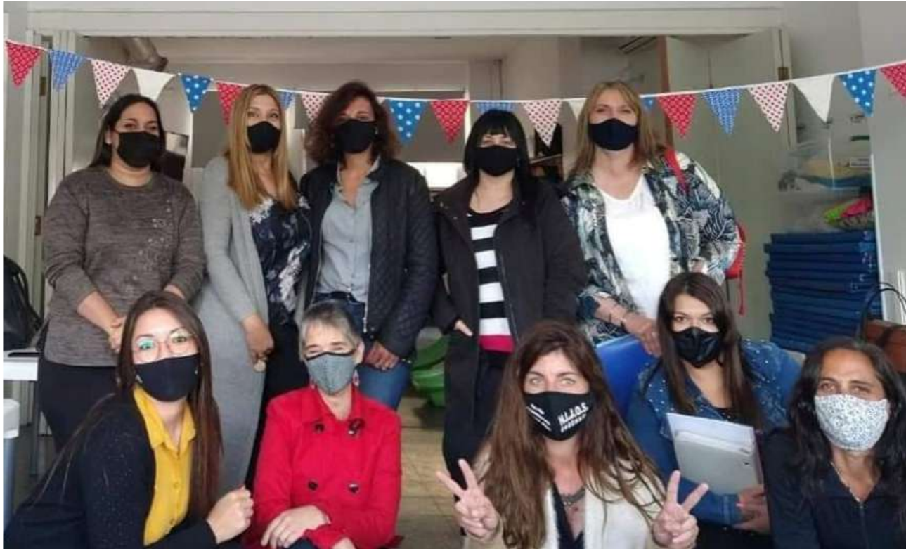
Parte del equipo de trabajo en una reunión durante 2020