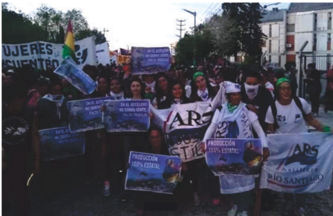
Compañeras del ARS en el Encuentro Nacional de Mujeres 2018.

Resalta que espera que este proyecto tenga un gran impacto en todos los niveles y que se continúe adelante, “que haga ruido”, y cierra expresando “Ojalá que ocurra que más chicas entren en producción.”