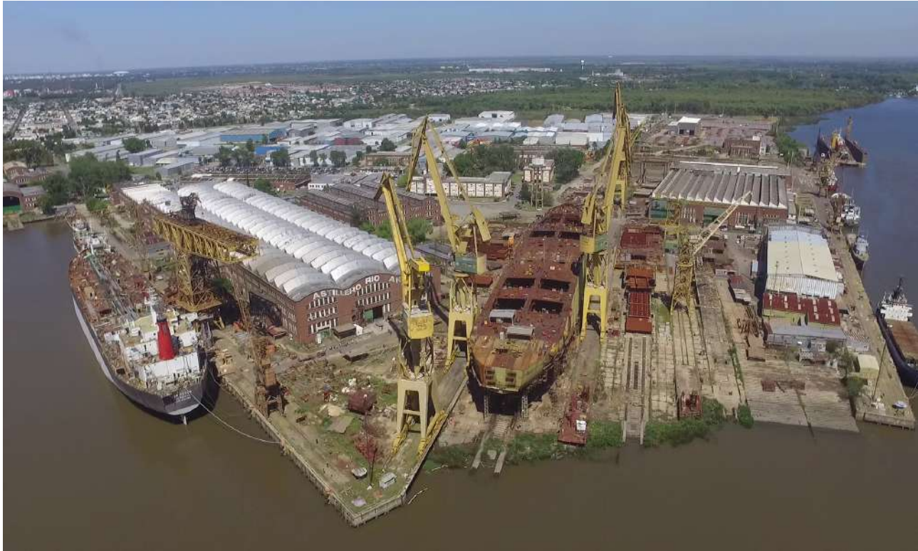
Vista aérea del Astillero Río Santiago con los petroleros “Eva Perón” y “Juana Azurduy” en construcción.