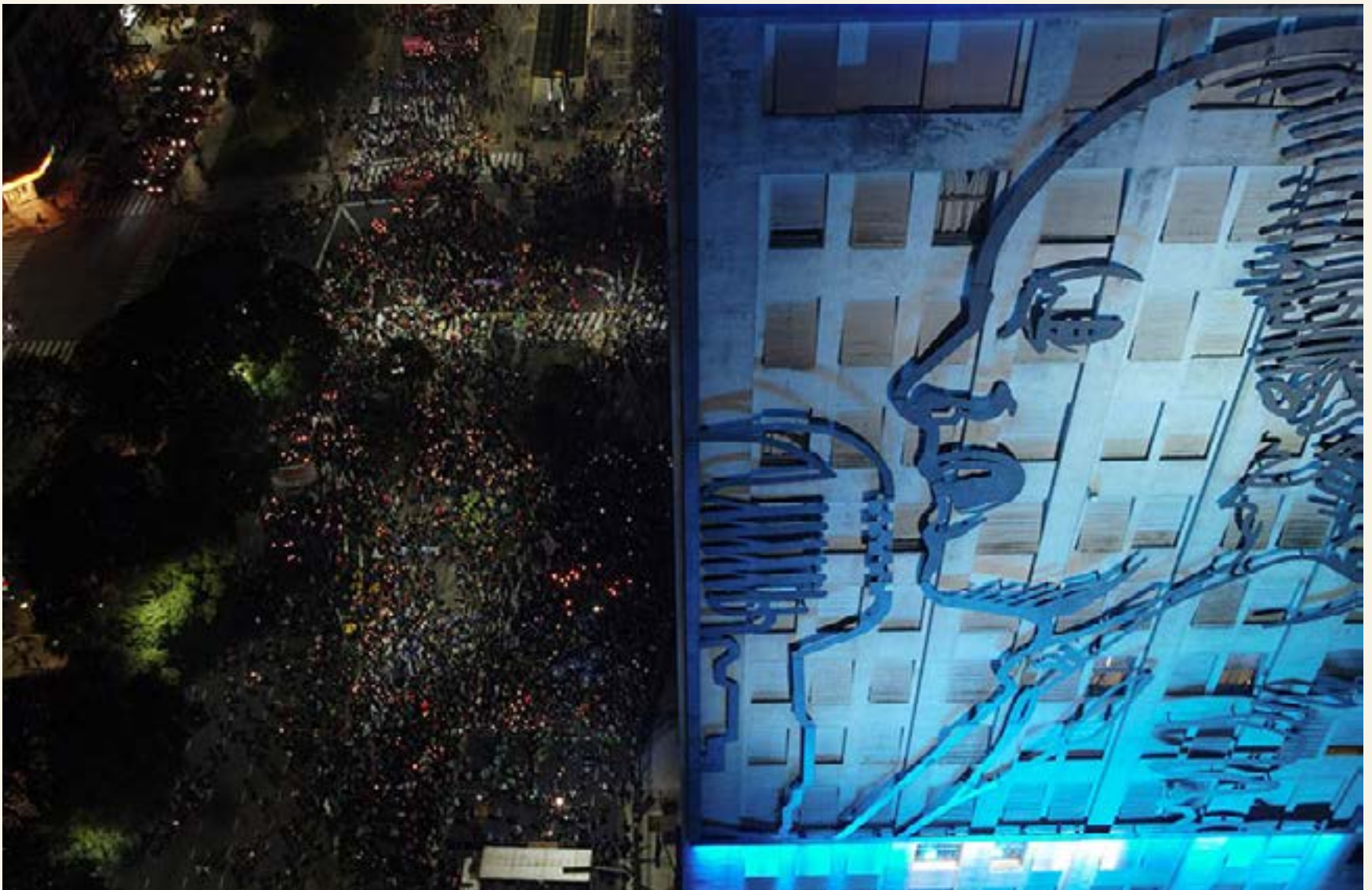
Trabajadores y trabajadoras el 26 de julio en la Marcha de Antorchas